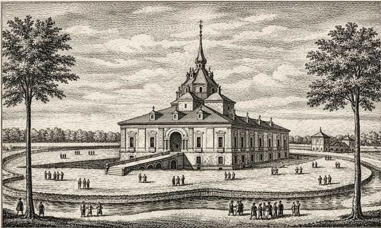
— Hermita de San Antonio — Buen Retiro. —